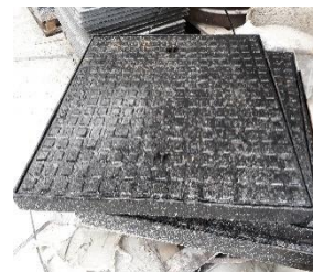
Gietijzeren deksel B125kN